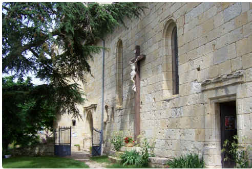
les chemins d'art en armagnac marsolan 001.JPG