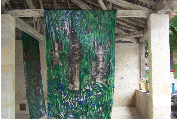
Les chemins d'Art en Armagnac : du côté de Marsolan

Photo : Une des oeuvres installée sous le préau