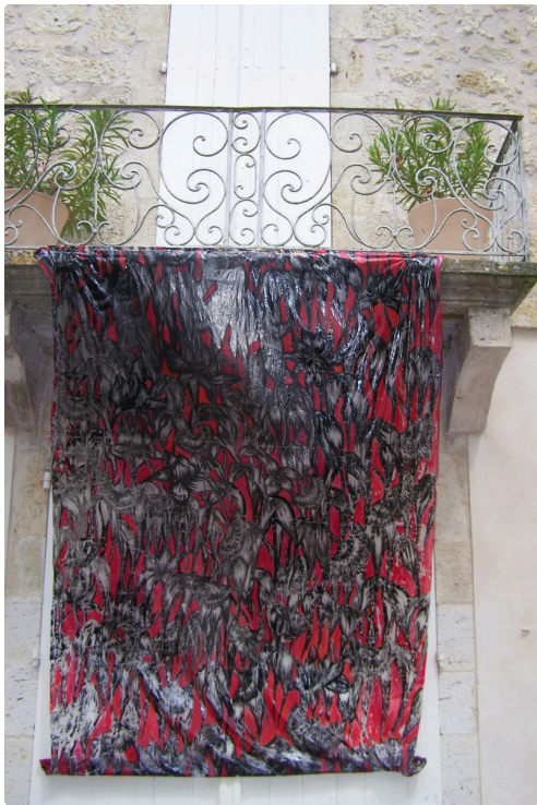
Art contemporain et patrimoine sont un étonnant mélange !