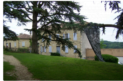
les chemins d'art en armagnac marsolan 005.JPG