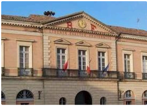
place de la mairie, lieu potentiel d'exécution