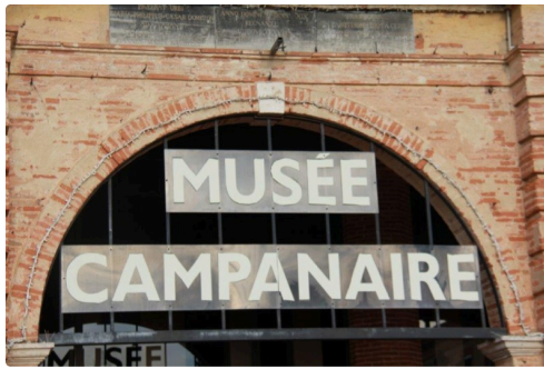
devant le musée lislois, autre lieu potentiel d'exécution