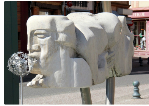
place Gambetta, autre lieu potentiel d'exécution