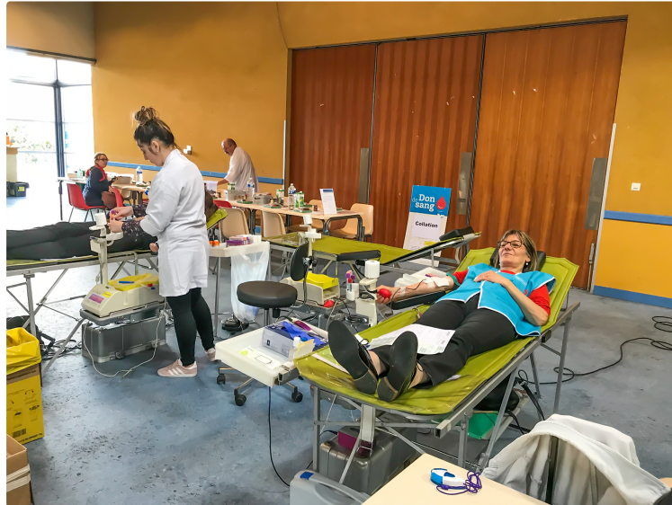
Don de sang à la salle d'animation de Nogaro

Ouvert à toute personne remplissant les conditions indiquées