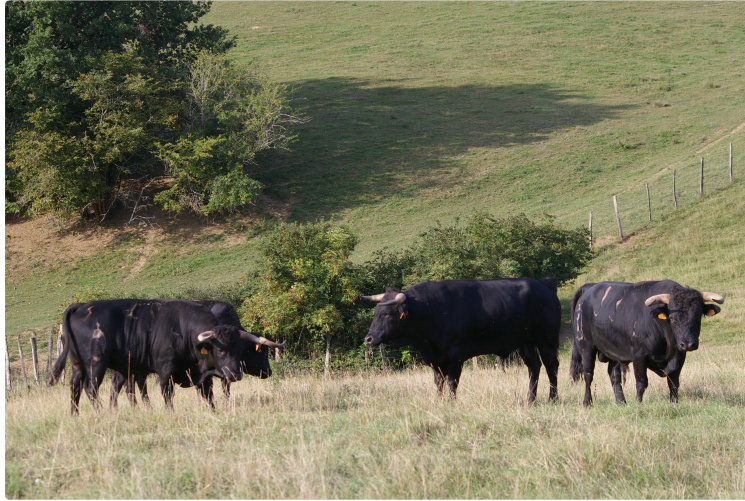
Quand les caprices du temps perturbent les animations des "Amis du Lartet"

La sortie du 9 juin "Au Campo" a du être annulée