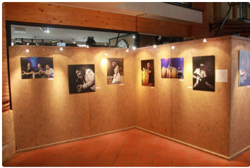
Les diverses présentations en trois séries dans un bel ensemble