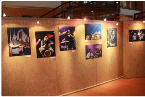
Les diverses présentations en trois séries dans un bel ensemble