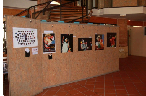
Les diverses présentations en trois séries dans un bel ensemble