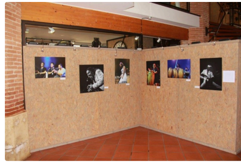
Les diverses présentations en trois séries dans un bel ensemble