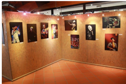
les diverses présentations en trois séries dans un bel ensemble.