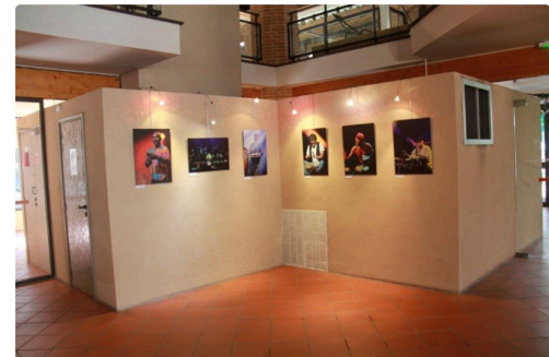
Les diverses présentations en trois séries dans un bel ensemble