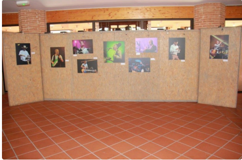
Les diverses présentations en trois séries dans un bel ensemble