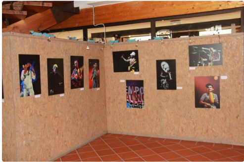
Les diverses présentations en trois séries dans un bel ensemble