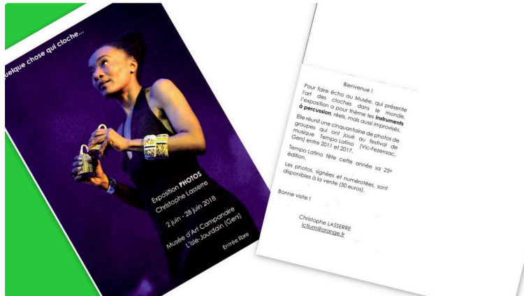
Y a quelque chose qui cloche

Exposition photo de Christophe Lasserre en l'Espace Pierre Lasserre