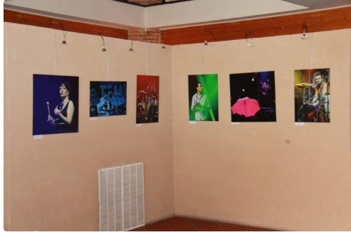
Les diverses présentations en trois séries dans un bel ensemble