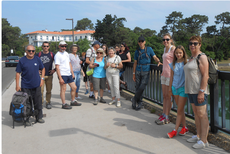
Un week end landais pour le club des coteaux

Le club des coteaux de Lagardère vient d'effectuer une sortie au lac de Seignosse dans les Landes. Il s'agissait de la sortie annuelle programmée sur trois jours, du vendredi 1ier au dimanche 3 juin. Les 21 participants se sont retrouvés au camping au nord du village avec un accès direct sur la plage, un accès pour la promenade en vélo ou bien à pieds dans la forêt landaise. A près une première nuit toute l'équipe était prête à découvrir le nouveau paysage landais. Pour ce samedi 2 juin un groupe de 15 personnes a opté pour une randonnée pédestre de 12kms et un autre groupe de 6 a choisi la promenade en vélo sur un circuit de 24kms dans la forêt landaise et le littoral, l'après-midi quartier libre pour flâner à sa convenance selon ses envies. Rassemblement en soirée autour d'un repas partagé très convivialement au camping. Pour le dernier jour dimanche, tous ensemble à pieds ils ont fait le tour du lac d'Hossegor, vestige de l'ancien estuaire de l'Adour, ce lac est alimenté par les eaux de l'atlantique et se vide presque complètement à chaque marée avant de se remplir de nouveau. A midi le repas à Capbreton, citée marine avec ses superbes paysages, puis une dernière flânerie dans ce cadre reposant avant de prendre la route du retour pour conclure ce weekend qui laissera pleins de bon souvenirs à tout le monde.