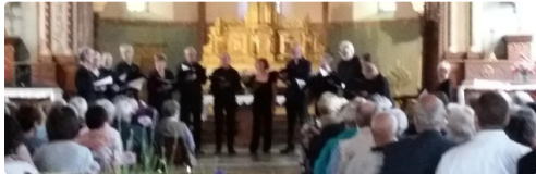
Resized_20180603_174148_7551 - Copie.jpeg