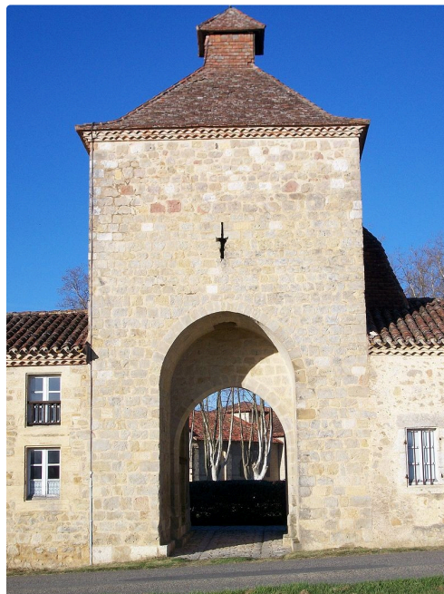
le portail de l'abbaye (photo de l'abbaye avec accord conservateur)