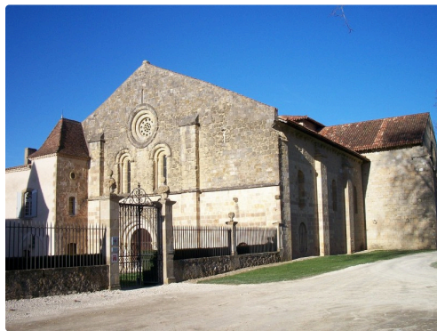
l'abbaye cistercienne (photo de l'abbaye avec accord conservateur)