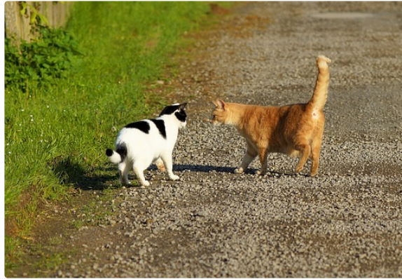
Vide greniers Chapatounes.

Action de soutien à l'association de protection animale.