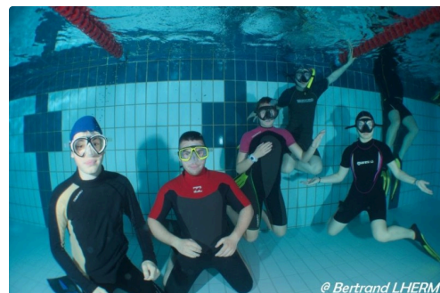
Du fond de la piscine...