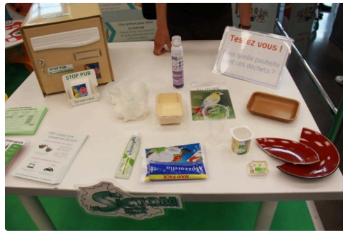
les diverses possibilités à choisir