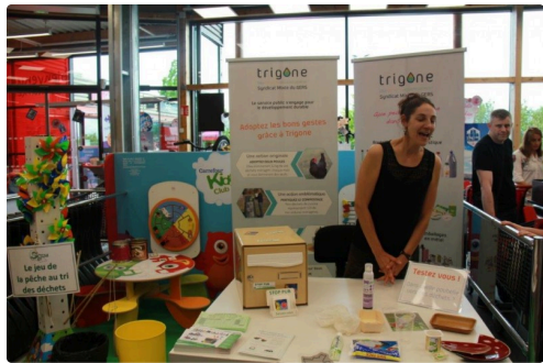
le stand de formation