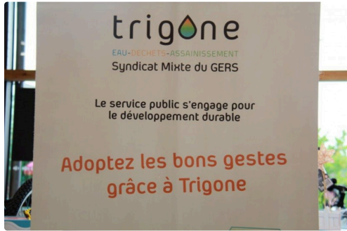
pour adopter les bons gestes