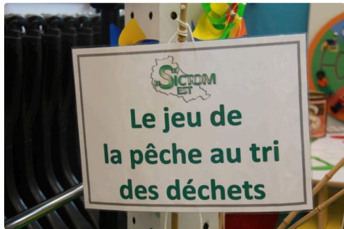
pour les enfants le jeu de la pêche au tri des déchets