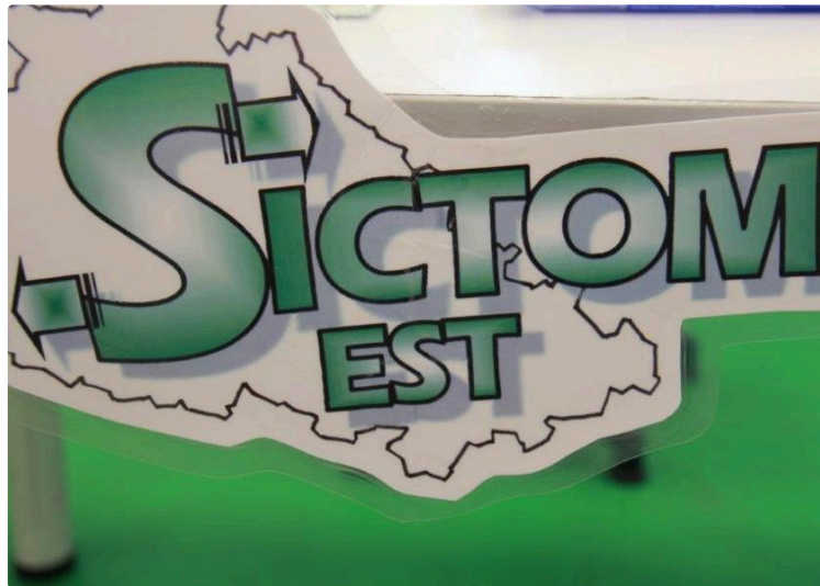
formation au tri au magasin Carrefour Market

Le Sictom Est en partenariat avec Trigone éduque les clients