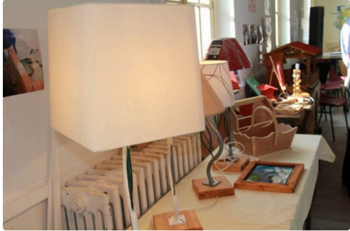
les résultats d'un travail