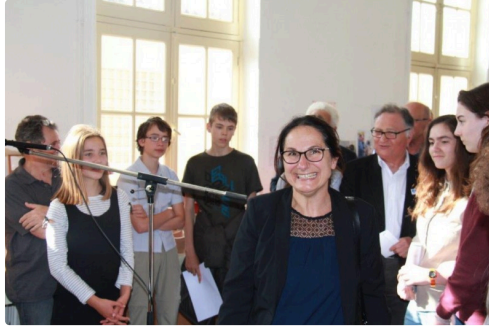
l'honneur départemental de la chambre des métiers