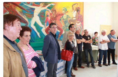
élus et artisans retraités