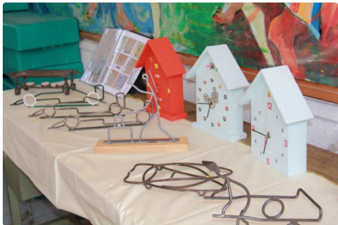
plein d'autres réalisations