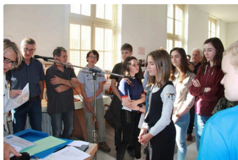
une partie des enfants récompensés