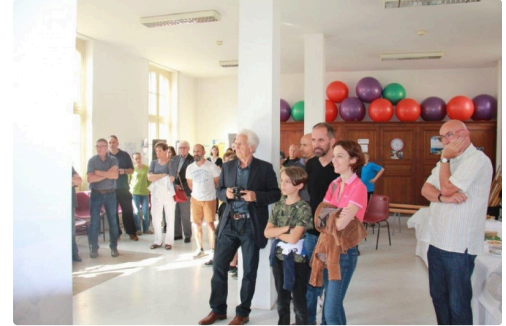
parents et enfants