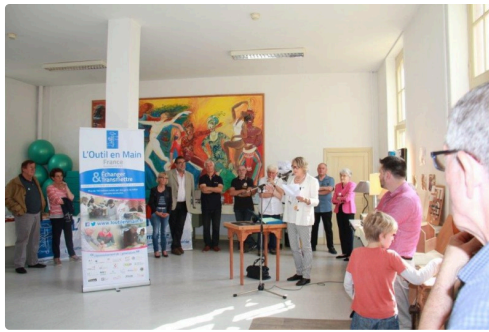
l'assistance dans la salle de la Halte Saint-Jacques