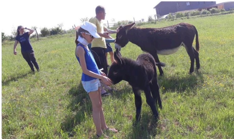
On fait quoi ce week-end ?

Dans le Grand Auch cœur de Gascogne, on met vos sens en éveil en ce début de mois de juin; que de douceurs pour vos yeux et vos oreilles ! et vos papilles vous diront merci... Voici votre agenda des 1er, 2 et 3 juin 2018.