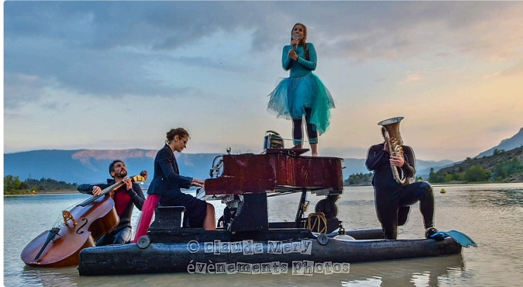
Le pianO du lac : concert flottant

Il passera par l'Isle-Jourdain, Castéra-Verduzan et Marciac