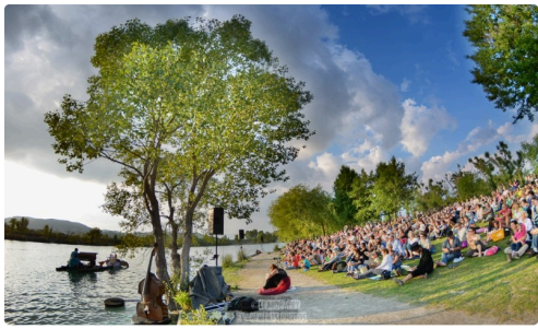
Doux moment d'évasion