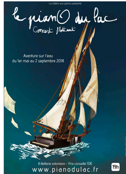
affiche pianO du lac mai-aout 2018 bass déf.jpg