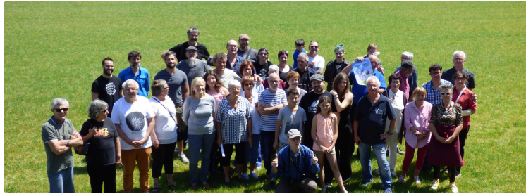
Le festival de la caricature et du dessin de presse a fermé ses portes

Les dernières images d'une belle manifestation