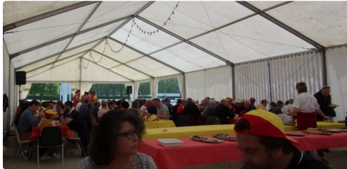
Buffet d'avant rencontre

A noter un "super" buffet d'avant match était proposé par l'USL, encore une fois une très bonne organisation.