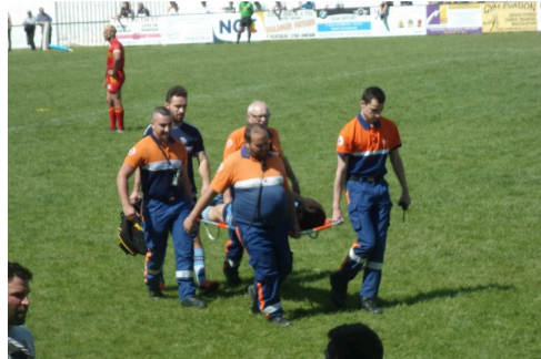
Joueur fleurantin évacué