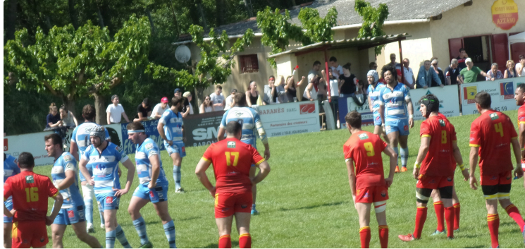
USL/ 1ère manche ratée..

De nombreux amateurs de rugby sont venus assister aux 8èmes de finales de Fédérales 2 au Stade Lapalu ce dimanche. Lors de ce derby gersois gersois, les équipes de Fleurance et de L'Isle-Jourdain se sont affrontées sous un soleil radieux. L'on s'attendait à ce que les lillois ne s'en laisse pas compter par les fleurantins, mais durant la 1ère période les sangs et or passèrent rarement la ligne médiane. Dès la vingtième minutes les bleus et blancs allaient noircir le tableau: 0/3, 0/6, 0/9, même après la pause les rouges et jaunes, malgré leur volonté, ne réussissaient pas à prendre la main. Les joueurs de la Lomagne ajoutaient 7 points par un essai transformé (0/16), tout semblait "cuit" mais quand on connaît les lillois rien n'est impossible et dans les 20 dernières minutes le réveil eu lieu: 2 essais transformés! L'histoire ne semble pas terminée et dimanche 27 à Fleurance l'on peut s'attendre à tout, à condition que les sangs et or décident de gérer la partie un peu plus tôt..... bien sûr !