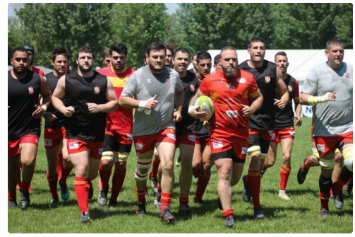
Sang et or