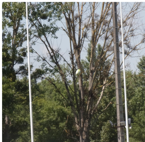
Transformation du 1er essai lillois