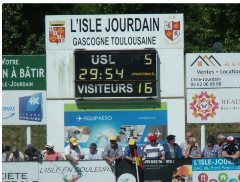
1er essai lillois