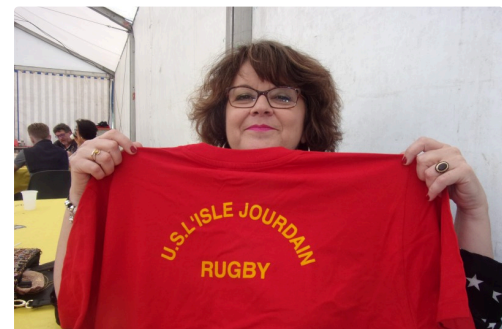
Une gagnante à la tombola