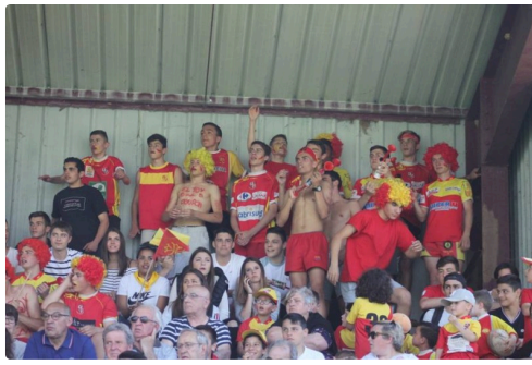
Les supporters lislois