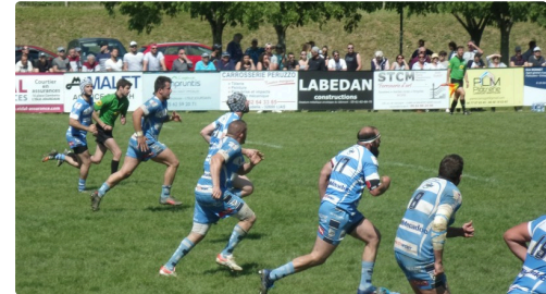
Equipe de Fleurance en attaque