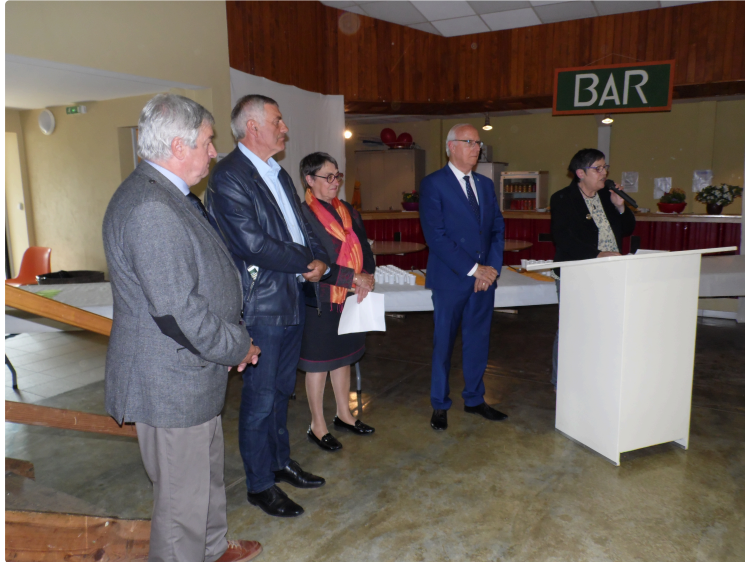
Vingt sixième salon des métiers d'arts

Quinze artisans sur vingt neuf en première participation