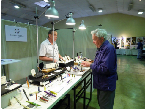
Des stylos même en bois