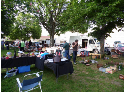
Le vide-grenier du dimanche au parc de l'église des 18 / 19 et 20 mai 2018