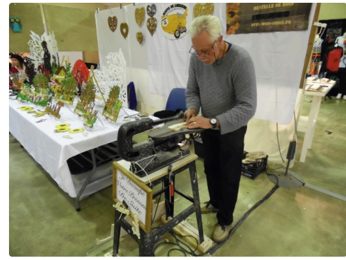
Réalisation de décors découpés en bois