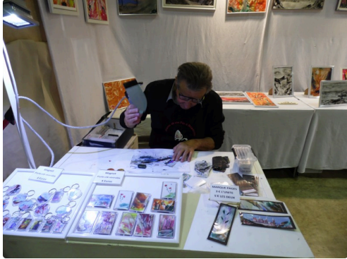
Comment faire des marque-pages