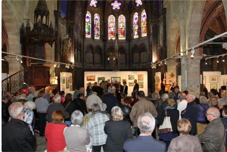
L'espace Saint Michel s'offre aux artistes amateurs