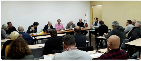
réunion de la communauté des communes