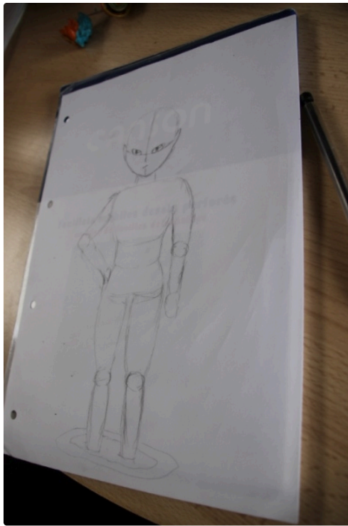
Beau travail !