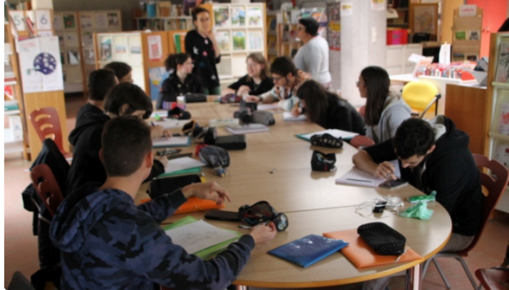
Venue d'une mangaka au CDI de Beaulieu