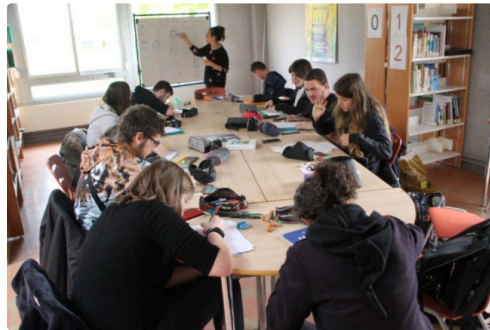
A l'écoute d'élèves attentionné.e.s