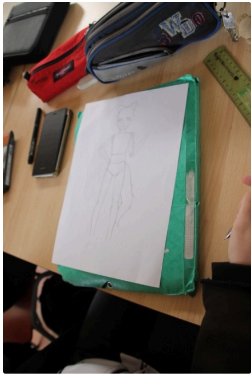
Pas mal du tout !