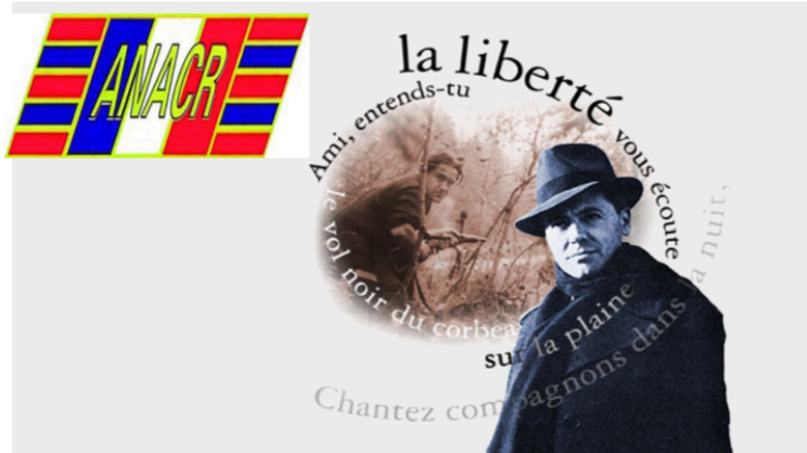
ANACR 32 : journée de la résistance

La Journée nationale de la Résistance ( date officielle, le 27 mai) est l'occasion d'une réflexion sur les valeurs de la Résistance et celles portées par le programme du Conseil national de la Résistance, comme :