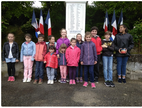
les enfants toujours volontaires pour participer à cet manifestation du Souvenir