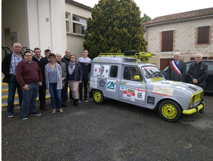
Commemration du 8 mai mais pas que...