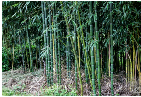
Bambous géants bleus