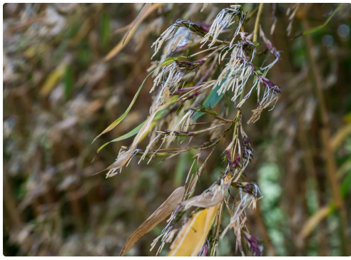
Gros plan sur les bambous en fleurs