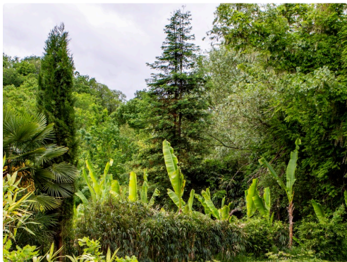
D'extraordinaires nuances de vert