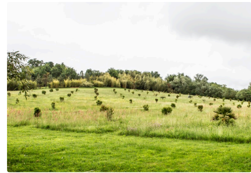
Le jardin mosaïque de lagerstroemias aux 5 couleurs fleurira en juillet