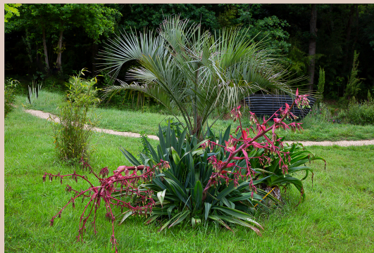
La Palmeraie de Bétous se met sur son 31