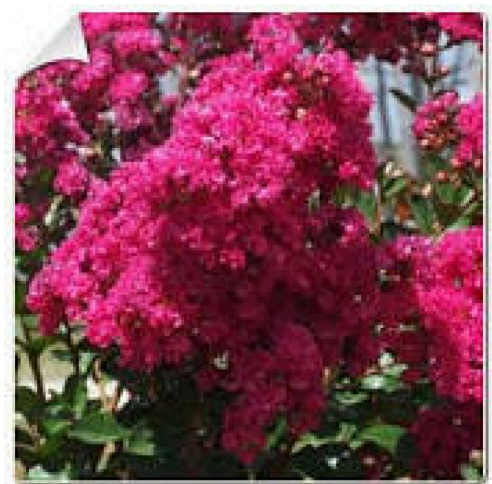
Un lagerstroemia