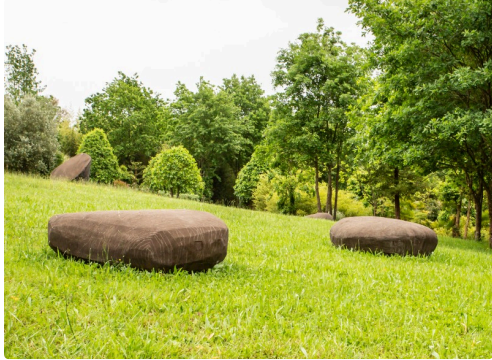
Galets gravés des Botta