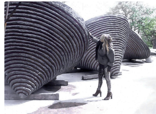
Les vasques des Botta - Photo Les Botta