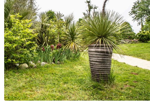
Un joli coin