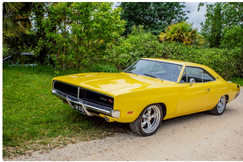
Une Dodge Charger