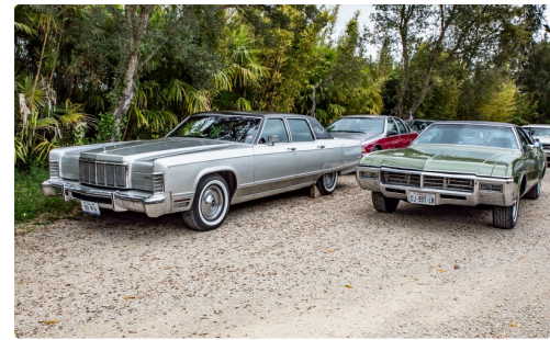
À droite une Buick Riviera ; à gauche une belle inconnue