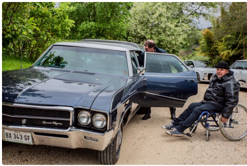
Une Buick Sport Wagon