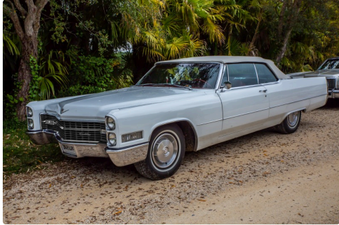
Une Cadillac discrètement garée