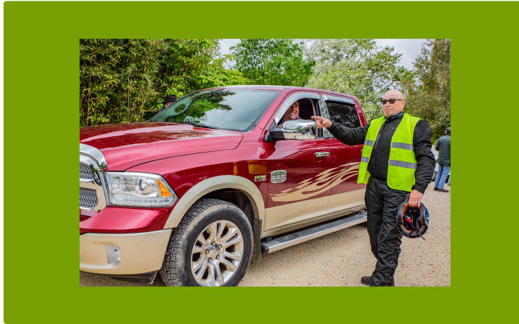
AmeriSud (les Américaines du Sud), visite la Palmeraie de Bétous

Corvette, Buick, Cadillac, Mustang, Dodge etc.