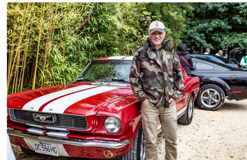
Une superbe Mustang