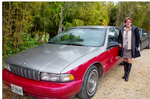
Une superbe Chevrolet