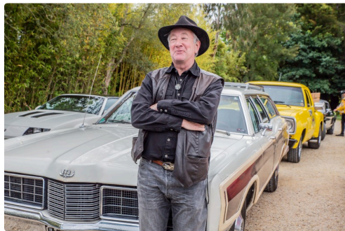
Le président d'AmeriSud

N.B. - La photo du haut de page montre l'organisateur de la sortie en action.