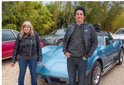
Une superbe Corvette