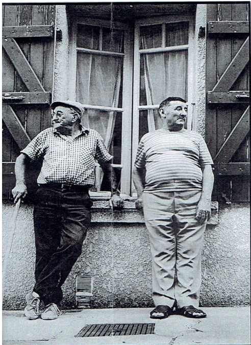
à deux c'est mieux