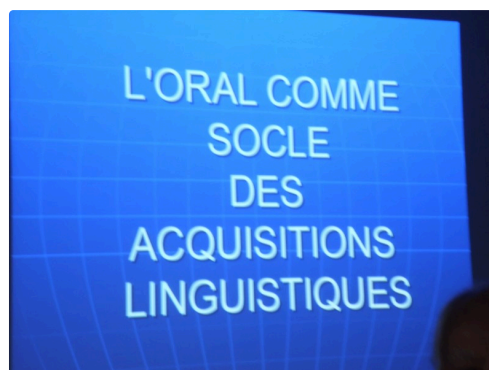
L'oral socle des acquisitions linguistiques