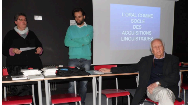
OC-BI Occitania et Association des parents d'élèves : Conférence au collège Pasteur

Vendredi en début de soirée les Associations Oc Bi Occitania et l'Association des parents d'élèves de Plaisance organisaient une conférence sur le thème du bilinguisme précoce dans l'enseignement public.