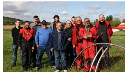
Les participants de ce premier Tour du Sud-Ouest en paramoteur