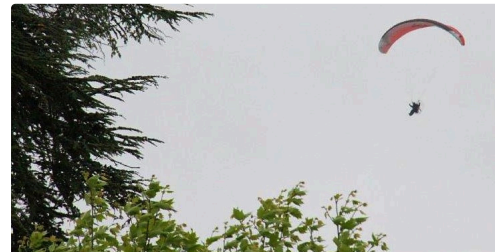
Retour à Condom