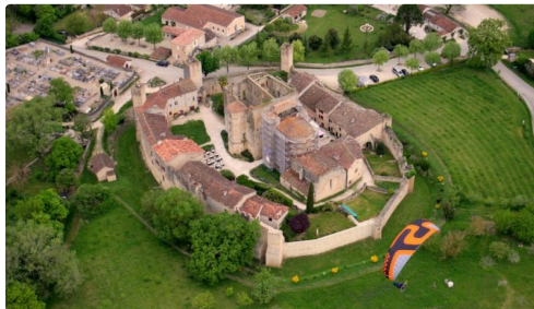
Survol de Larressingle