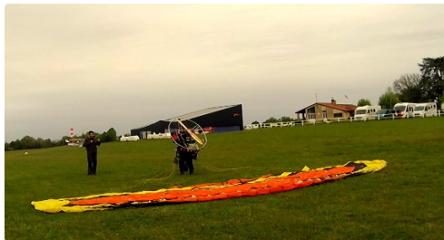
Décollage de l'aérodrome du Herret