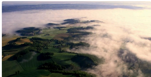
Des images à couper le souffle