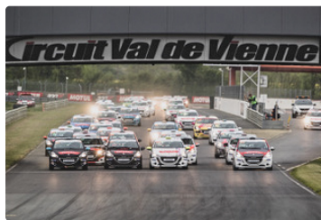
Départ au circuit du Val de Vienne