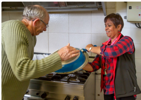
L'omelette est retournée