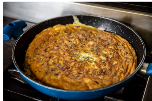
L'omelette est prête