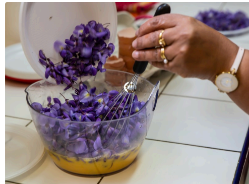
Les fleurs sont posées délicatement sur les œufs