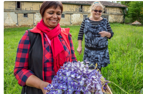
Le panier est plein