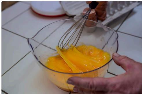
Les œufs sont battus