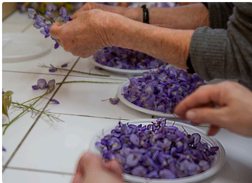
Les fleurs sont séparées de leur grappe