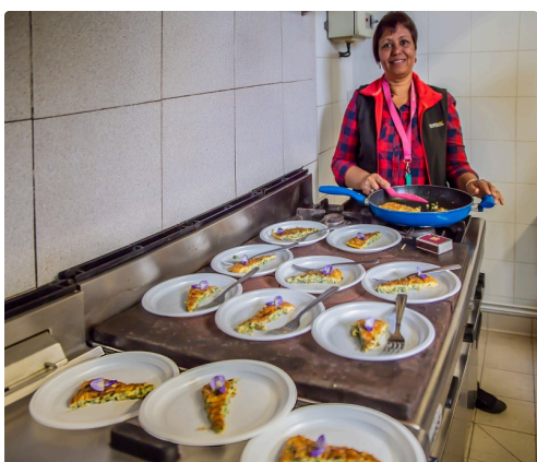
Il n'y a plus qu'à déguster !