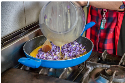
Les œufs et les fleurs sont mis dans la poêle