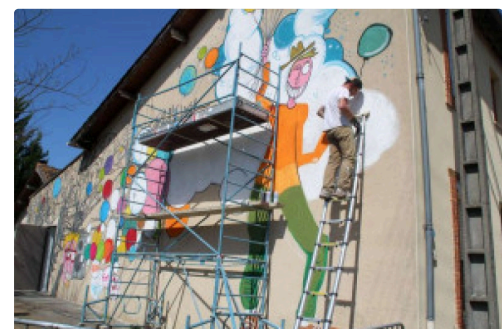
Freaks The Fab