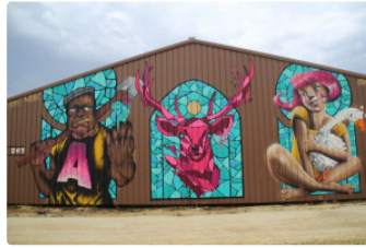
Street' Art'Magnac, un très bon cru

Suite à la 4e édition du Street' Art'Magnac, organisée par l'association ECLA, et qui a eu lieu du lundi 16 avril jusqu'au dimanche 22 avril, l'heure du bilan très positif est arrivé.