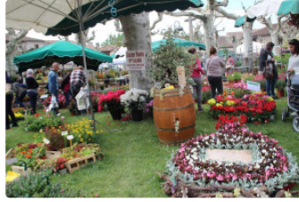
Marché aux fleurs de Fourcès, un bon cru

Samedi 28 avril dès 8 h 30 le public émerveillé a découvert la 43e édition du Marché aux fleurs, organisé par l'association Arrebiscoula.