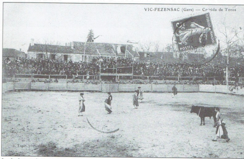
La foule nombreuse occupe les gradins mobiles et les talenquères. Des courses de taureaux ont été organisées au foirail en 1878, 1894, 1904, 1906, 1908...