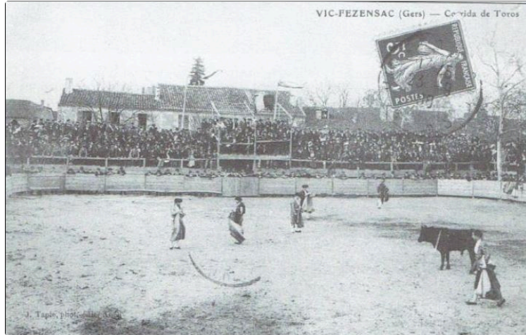
Vic taurin 1851