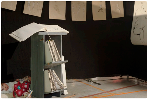
Le Grand Baz'Art