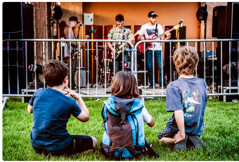
des jeunes au spectacle