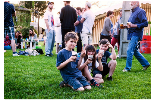
des jeunes au grand baz'art