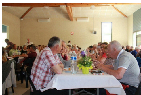
des convives plus que ravis