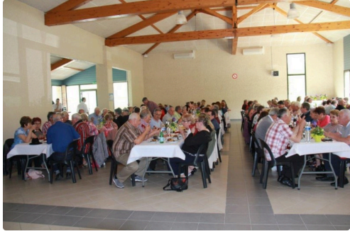
quatre belles tablées