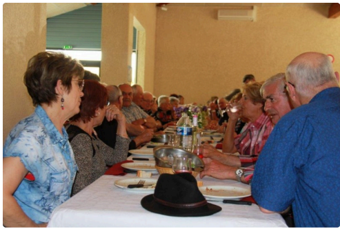
des convives plus que ravis