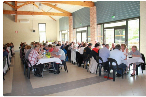
quatre belles tablées