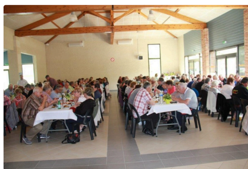
quatre belles tablées