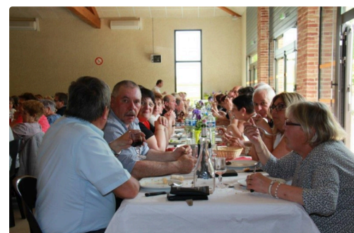
des convives plus que ravis