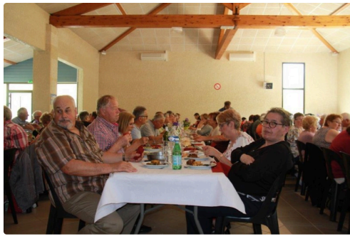
des convives plus que ravis