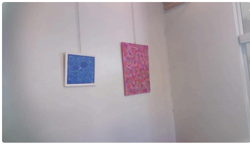
Œuvres diverses d'une artiste aux multiples facettes