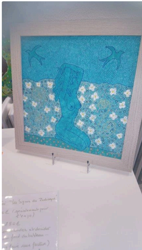
Œuvres diverses d'une artiste aux multiples facettes

Corinne Bobier sera dimanche prochain au Château de Clermont-Savès en compagnie de Pierre Colin, auteur compositeur interprète ou vous pourrez retrouver cet univers poétique et coloré des peintures de l'artiste