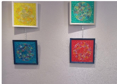
Œuvres diverses d'une artiste aux multiples facettes