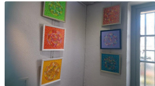
les signes du zodiaque