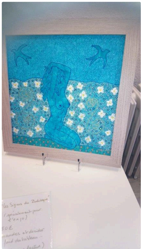
Autre oeuvre digne d'intérêt