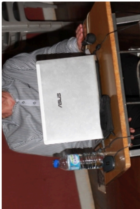
Le général André Mengelle

Un bel hommage rendu à nos militaires de cette dure période pour cette soirée longuement préparée par le Général André Mengelle.