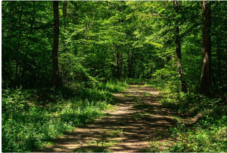
Propriétaires forestiers en assemblée.

L'association des propriétaires forestiers des communes d'Aux-Aussat, Estampes-Castelfranc, Estampures, Fréchède, Laguian Mazous, Montégut Arros et Moumoulous a tenu son assemblée générale annuelle à la salle des fêtes d'Estampes.