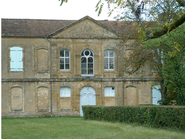
L'abbaye de Berdoues au temps de sa splendeur