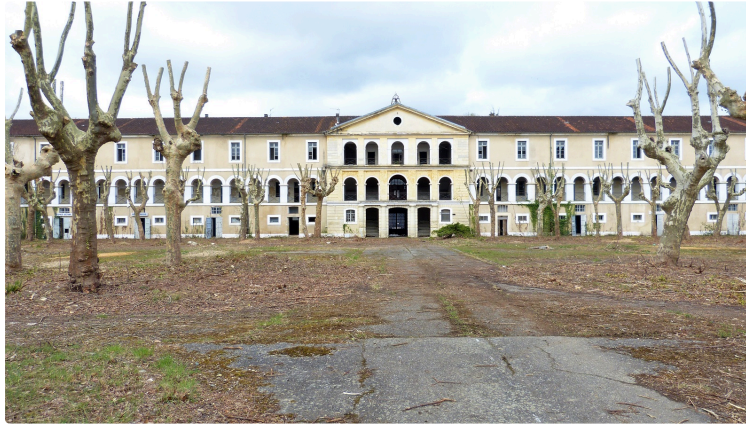
AUCH : Requalification de la caserne Espagne