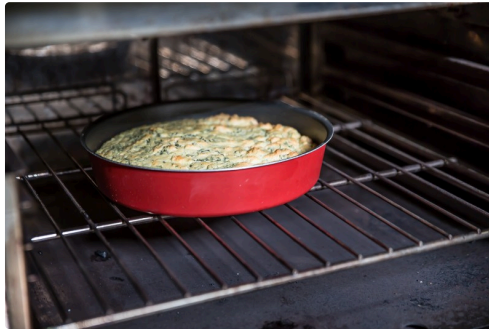
Sortie du four