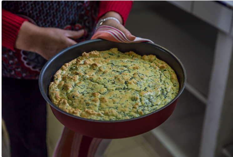
Toujouse – Un délicieux soufflé aux herbes sauvages

Une nouvelle recette du cours de Nadia Boyer