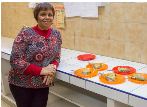
Il n'y a plus qu'à déguster