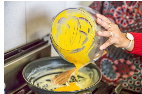
Mélange beurre farine et jaunes