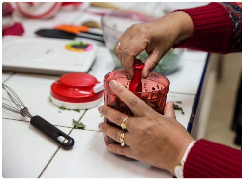
Les plantes sont hachées menu