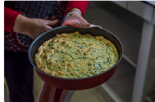
C'est prêt !