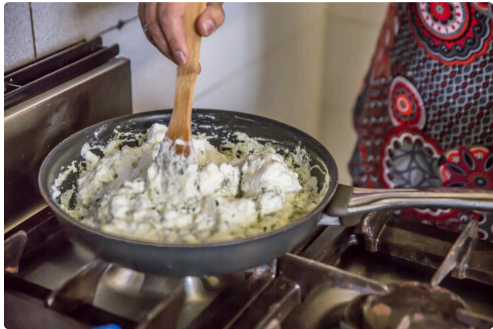
Incorporation des blancs en neige