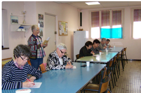
Début de la dictée

Après la réflexion, la décontraction par quelques agapes, moment convivial avec café et friandises pour les participantes avec à l'appui un jeu de rapidité intellectuelle...de quoi encore faire fonctionner les neurones !