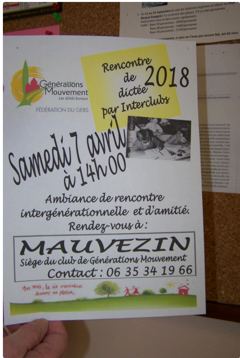
Affiche de l'animation