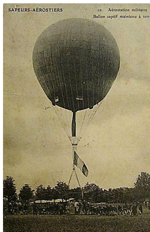
Capture d'écran (393).jpg

Son nom est transcrit sur le monument aux morts de Villefranche.