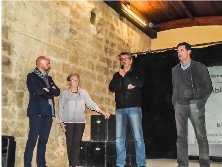
Termes-d'Armagnac - Bilan 2017 de l'Académie médiévale

Année très active mais avec moins de visiteurs