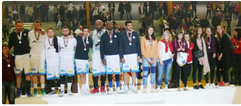
Les finalistes malheureux, les joueuses de Puycasquier et les joueurs de Castéra-Verduzan.