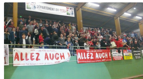
Les supporters auscitains.