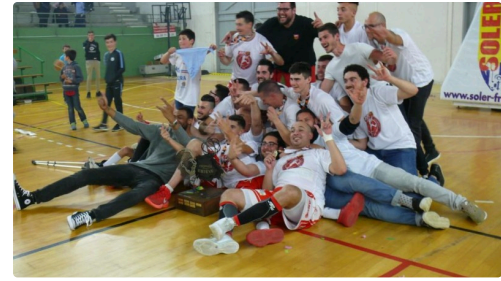
Heureux les joueurs auscitains.