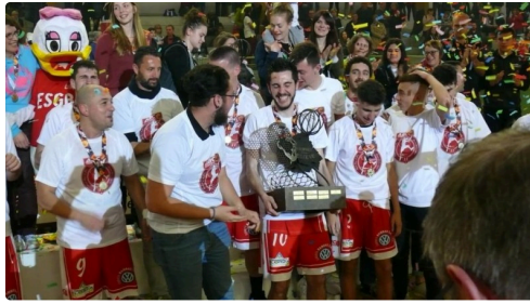
Les Auscitains et le trophée Georges Estève.