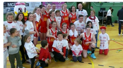
Les Gimontoises heureuses ...