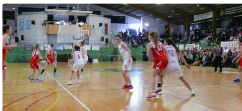
Phase de jeu.