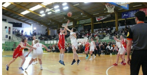
Phase de jeu.

A la reprise Gimont donne du rythme à la rencontre et par sa défense prend Puycasquier à la gorge lequel encaisse un 10 à 0 rédhibitoire. Dès lors les quelques sursauts des Puycasquiéroises ne pèsent pas lourd dans la balance celles-ci étant trop maladroites sur leurs actions. Et pour conclure les Gimontoises en remettent une couche avec un 12 à 0 pour mieux asseoir leur suprématie dans cette rencontre.