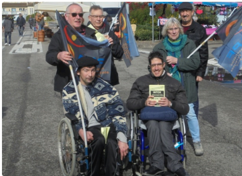
Sur le marché d'Auch

DESINTOX : 50 % des personnes en situation de handicap n'auront pas d'augmentation !