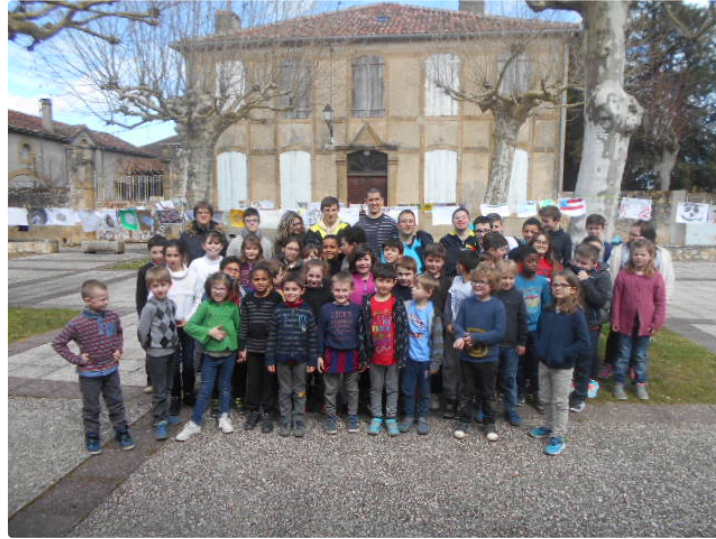
La "Grande Lessive" Quatrième édition

Le thème de l'édition de mars était : Pierres à images, Pierres à imaginer".