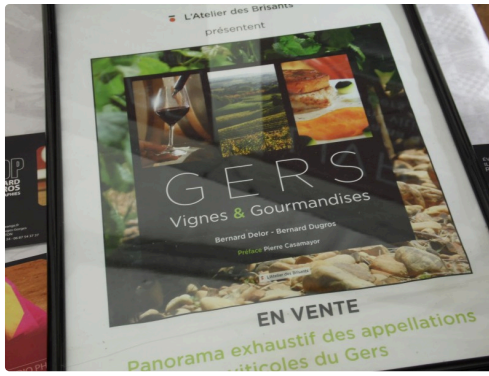
des 24 et 25 mars 2018