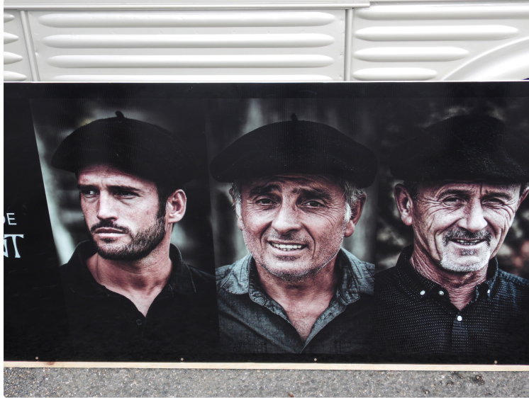
Saint Mont vignoble en fêtes

Dimanche il fallait encore faire entre les averses