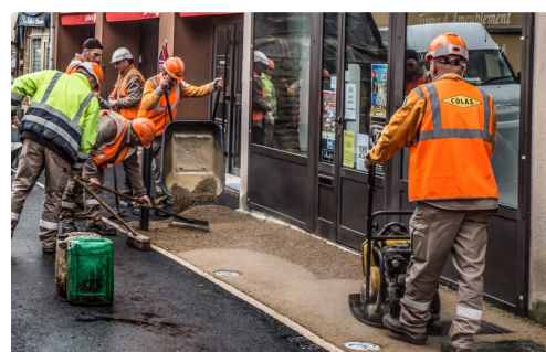
Étalage et tassement du revêtement sur un trottoir

Il restera encore des finitions à effectuer, mais elles n'auront lieu qu'en juin 2018. Vendredi 30 mars, le mobilier vertical sera posé (potelets, barrières, corbeilles à déchets, jardinières etc.). En juin, aura lieu le grenailage du goudron noir pour faire apparaître les cailloux et ensuite, le marquage à la peinture sur le sol. Ces finitions dureront environ une semaine.