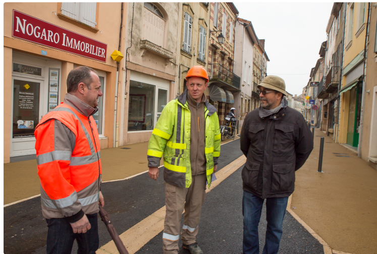
Fin du chantier rue de la République (ex-rue Nationale)