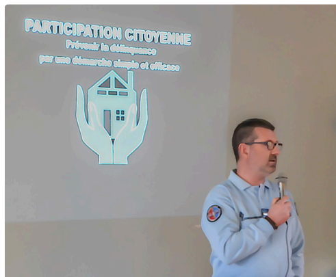
L'a/c Habernet fait sa présentation au Houga