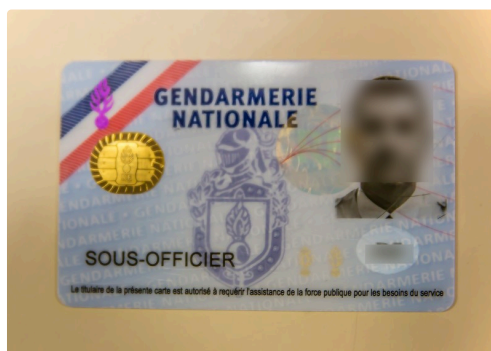
La carte en question, où le visage et le numéro ont été floutés